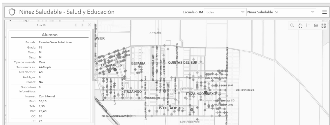
Figura 3: Ficha de un estudiante, contenida en el Dashboard de Niñez Saludable

En la Figura 3 se presenta el modelo de ficha de cada niño o niña que contiene información exhaustiva de cada estudiante. Como se puede observar en la barra de progreso a la derecha de la ventana hay más información debajo. Y en la parte superior hay una indicación que dice "1 de 10" y hace referencia a que son 10 páginas como ésta con información.