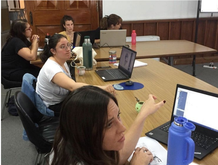
Figura 2: Curso dictado en la Facultad de Ciencias Humanas.